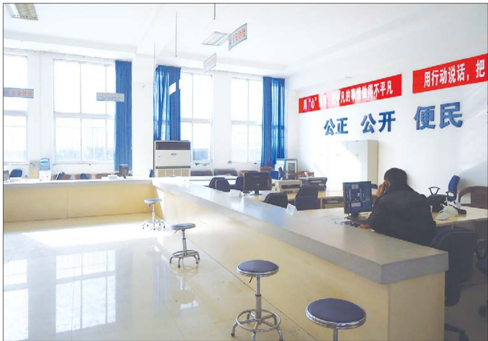
保险公司的快速理赔窗口比较冷清。

记者了解到,从2009年10月快速理赔中心成立,到年底共处理了493起事故。在2010年一年,通过快速理赔中心处理的案件达到3727件,到了2011年共处理了2169件,而到了2012年快速理赔处理却只有697件。从2009年3个月处理接近500件,到2012年全年只处理了不到700件,呈现了数量每年减少的趋势。