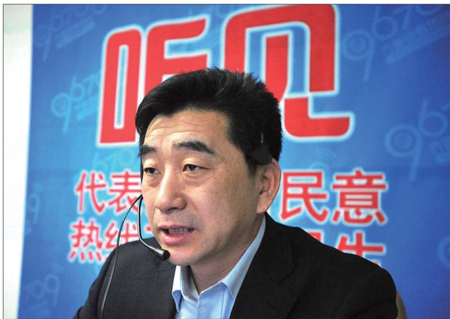
29日,省质监局副局长张健做客本报热线,并回答读者提问。