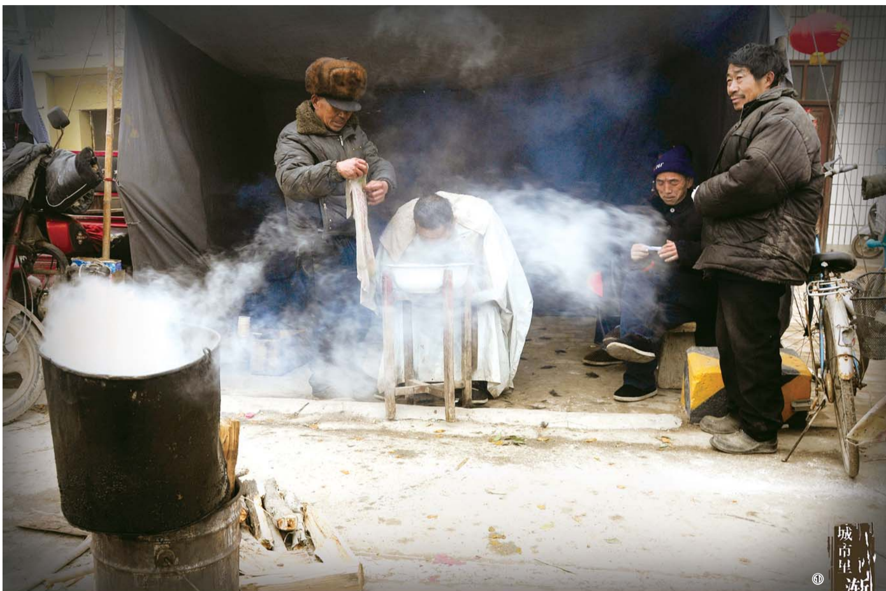
城市星 逝的行当 剃头匠