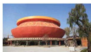
梦回大汶口情景体验馆。

为了生存，史前人经常撑着竹筏，在宽阔的水面上打捞捕鱼。游客乘坐漂流筏穿过原始丛林，经过各种灾难历程，在腾挪跌宕的河道中到达终点。