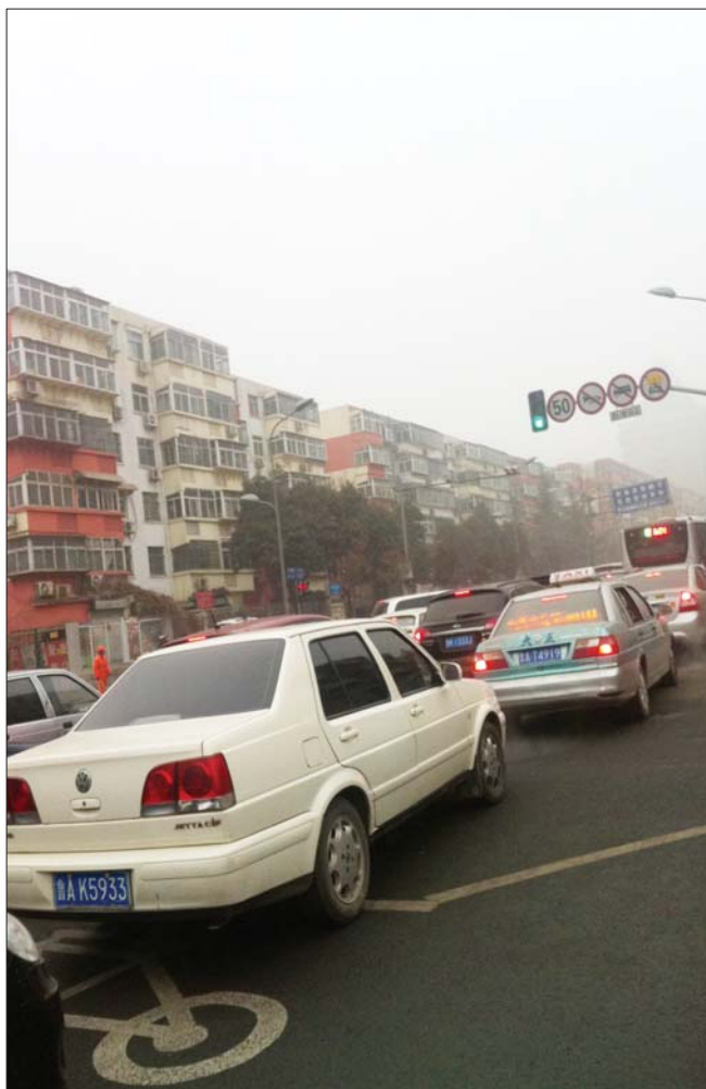
26日早晨,文化东路与燕子山路口虽已压车,但仍有不少车辆继续前行,彻底堵住了路口。

“遇前方车辆受阻排队等候时,不得鸣笛催促。”交警介绍,交警部门近期将严查此类违法行为。查只是手段,目的是促使大家都能自觉遵守交规,“作为驾驶人,这也是文明驾驶的必然要求,希望每个人都增强社会责任感,自觉遵守交通法规,规范交通行为。”