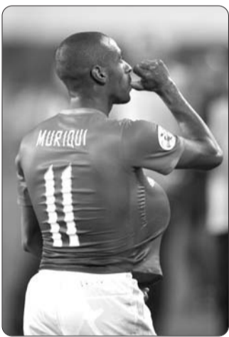
穆里奇在比赛中庆祝进球。

晚上8点的比赛,不到7点天河体育中心便涌进了大批恒大球迷。据有关人士介绍,本场比赛共有多达4.5万球迷到现场观战,其中绝大多数都是恒大的支持者,天河