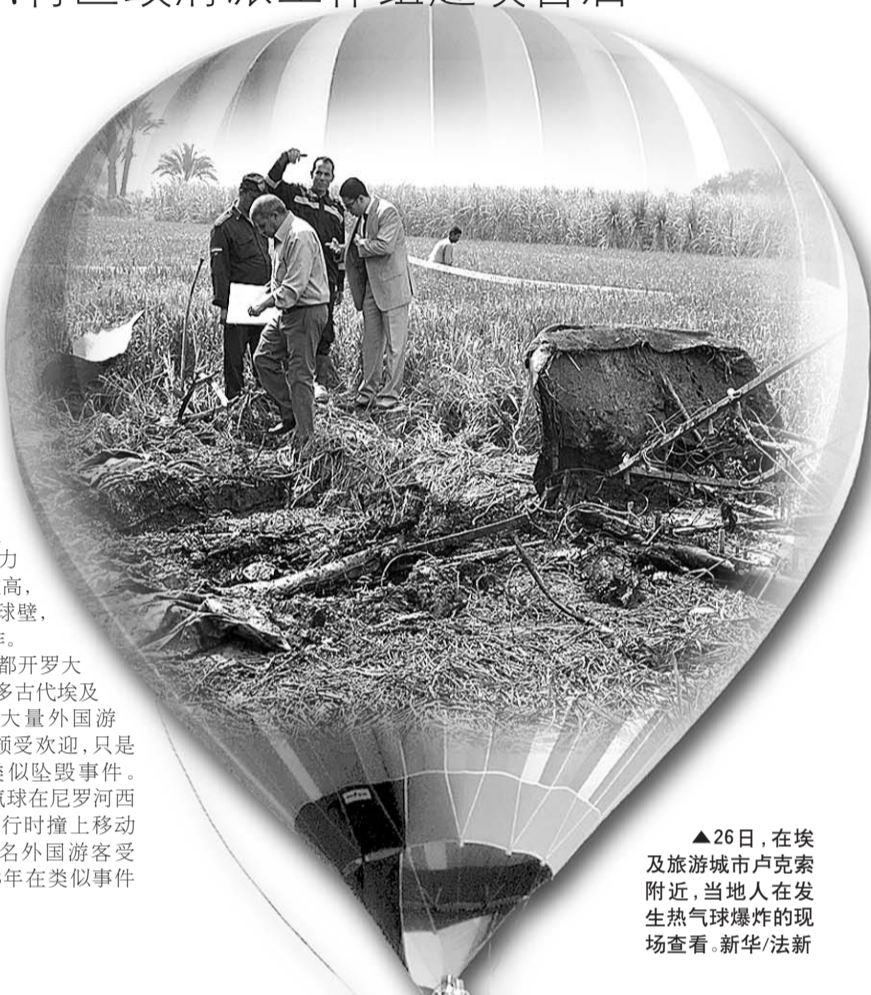
▲26日,在埃及旅游城市卢克索附近,当地人在发生热气球爆炸的现场查看。