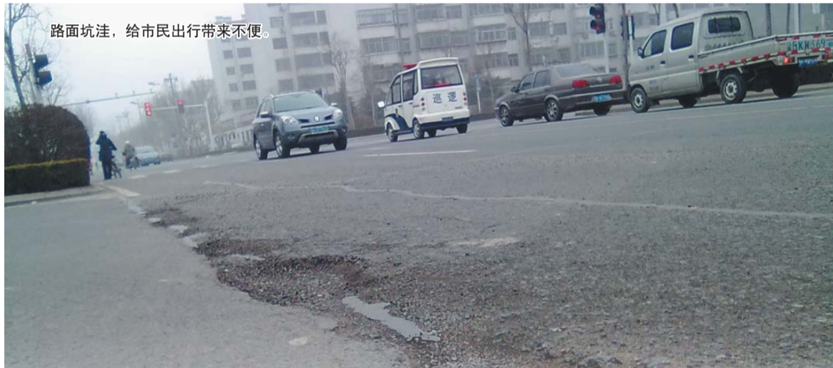
路面坑洼,给市民出行带来不便。