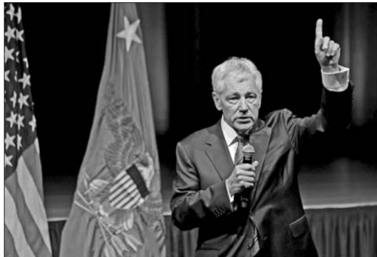
▲2月27日,新任美国国防部长查哈格尔在五角大楼发表讲话。

哈格尔认为,美国应该以谨慎态度和“明智”方式在海外“秀肌肉”,暗指美国海外军事行动。从阿富汗撤军将是哈格尔面临