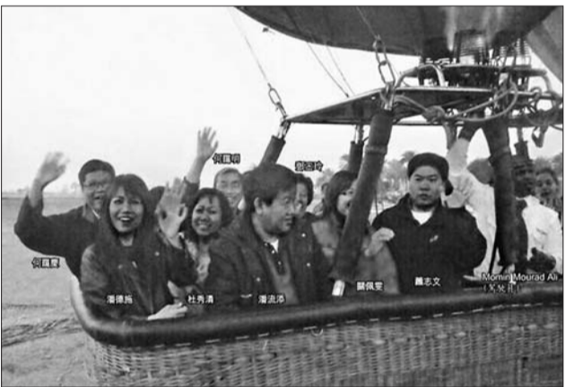
这是热气球爆炸事故中遇难的香港游客在登上热气球升空时刻的照片。