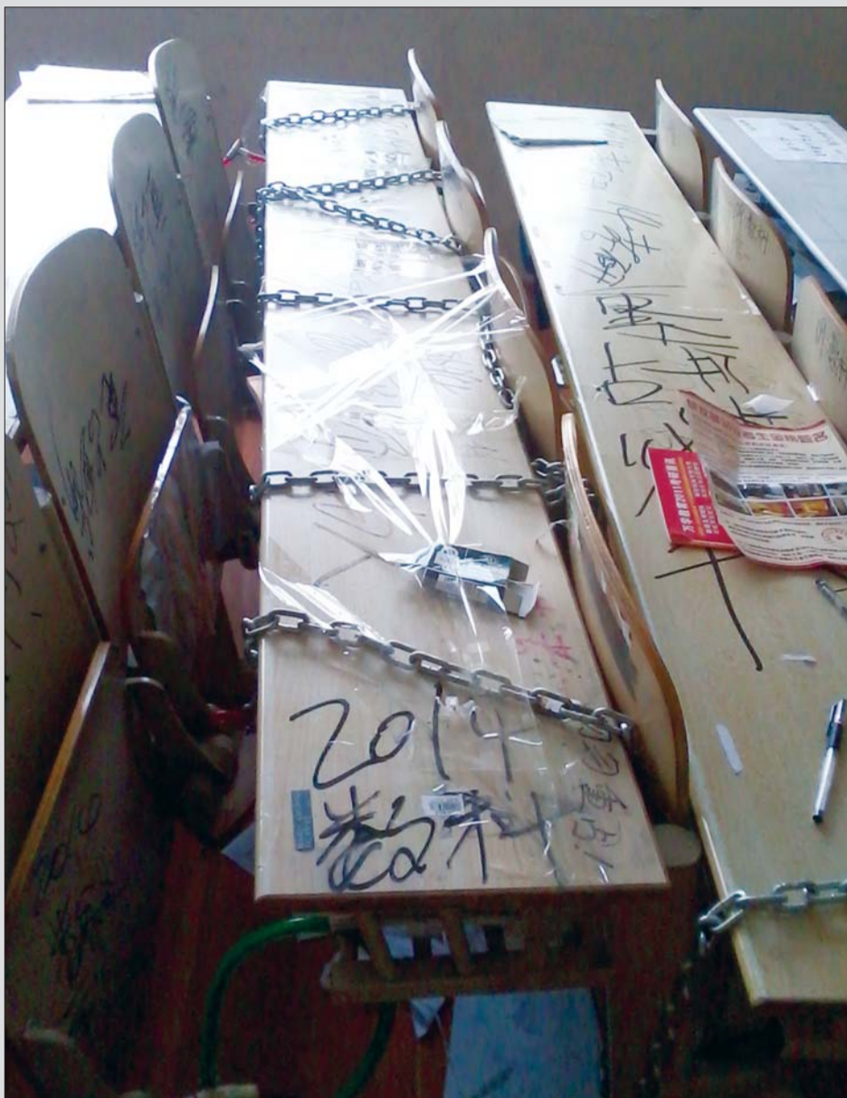
▲铁链加身,疯狂占座。