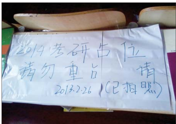
▲先来为“王”,照片取证。