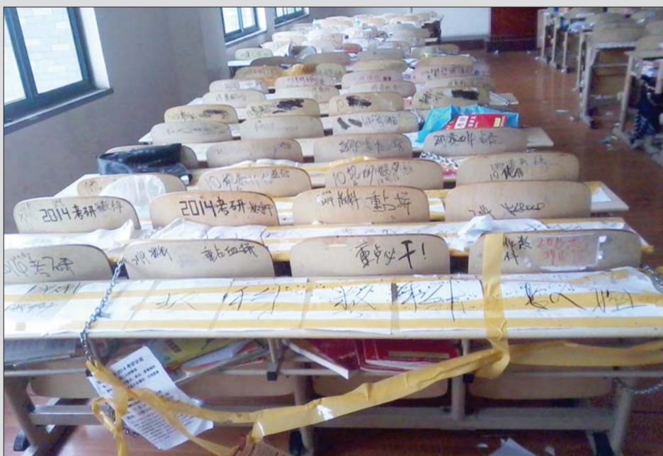
▲占座景观,让人开眼。