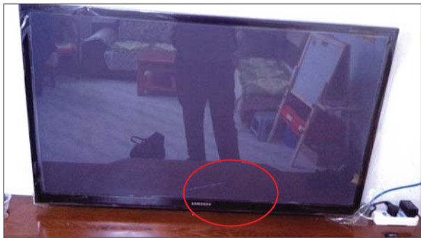
等离子电视的右下位置出现了裂纹。

消协工作人员在调查中发现,电视销售方接到姚先生的反应情况后到他家里进行了现场查看并拍照发到该品牌总部的品质部,品质部给予的鉴定结