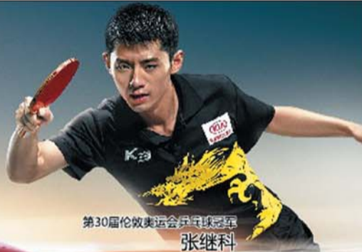
第30届伦敦奥运会乒乓球冠军 张继科