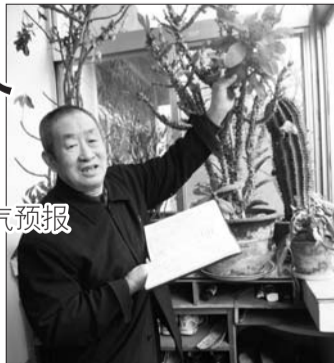
王珣老人每天都把天气预报记录在手中的这个本子上。