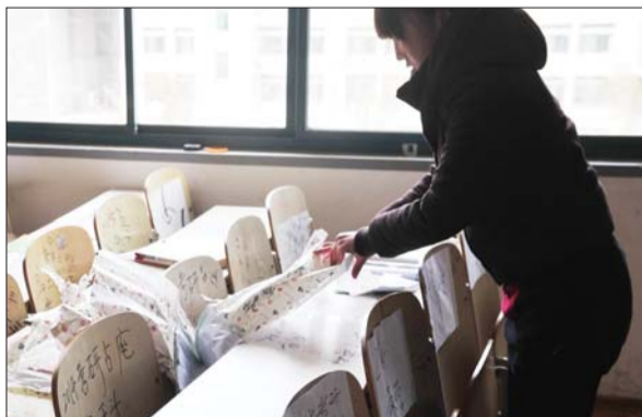
为考研占座，各出奇招。