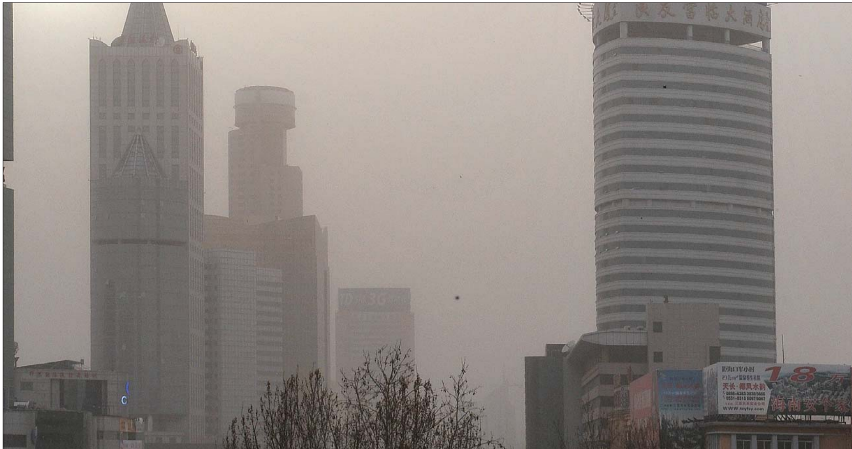
大风吹得沙尘树叶漫天飞舞，济南泺源大街笼罩在沙尘中。