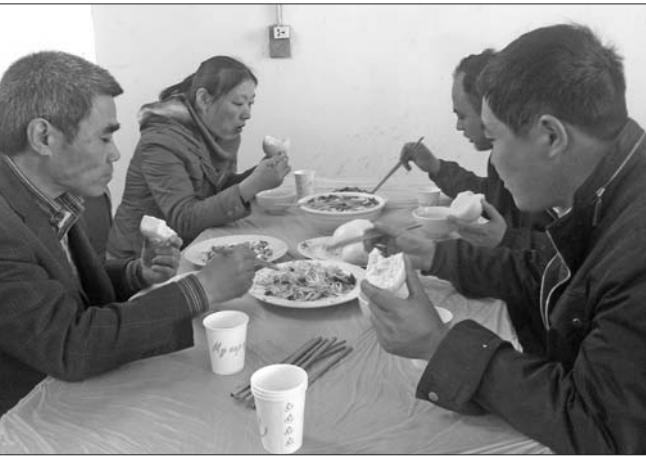
鄞城去年开始实施廉政灶制度,乡镇公务接待一律在食堂进行,每人标准不超20元。图为在一乡镇政府食堂吃廉政灶的鄞城县林业局等工作人员。(资料片) 本报记者 郭静 摄

去年12月28日,我省出台落实中央政治局八项规定的十条实施办法。此后,各市陆续跟进,纷纷出台实施细则。 此外,为厉行勤俭节约,多地取消了由政府主办的节庆活动,从省级到乡镇,各个级别的会议“素颜”亮相。 在反对铺张浪费方面,各地也出招加以控制。 青岛市市政府副秘书长、办公厅主任卞建平介绍,青岛市规定,节日期间党政机关、事业单位、国有企业内部不搞茶话会、联欢会、聚餐会,其他活动也要从简从俭。 戚汝庆认为,高层的倡导实践并不难,难的是长期这样做,更难的是各级干部都这样做,“在还没形成一种作风习惯时,上面不能放松,要抓住不放。”