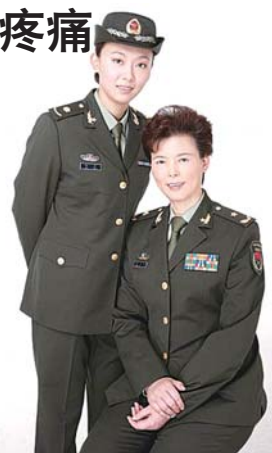
陈招娣与女儿的合影。

然而陈招娣还是没能再闯过这一关,15时许她的女儿发微博称:妈妈走好,那个地方没有疼痛,没有疾病,只有开心,还有两天我就26岁了,你又一次骗我,我不恨你,我依然爱你,妈妈我爱你。 (新体)