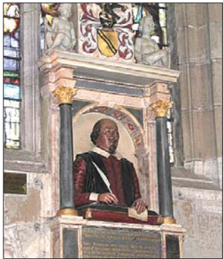
▲莎士比亚1616年去世后，家乡教堂为他竖起葬礼纪念碑，上面的莎士比亚手持一袋谷物。到18世纪，他的这一形象被手持软垫和羽毛笔的莎士比亚取代。