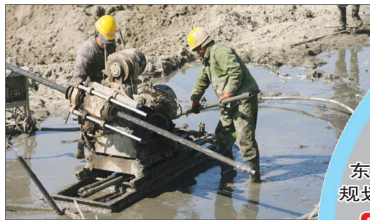
3月20日，烟台海洋产权交易中心工程现场，工人站在泥浆里施工，非常辛苦。记者 赵金阳 摄

从2012年初烟台市召开的第十二次党代会开始，一个全新的名词——“东部新区”在烟台被叫响了。这个被赋予了“核心”、“龙头”和“高地”的名字，市领导几乎是逢会必讲，每天必问，因为这当前和今后一个时期，都是烟台市的“一号工程”。