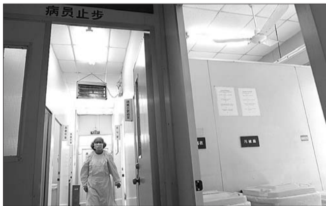
上海市立六院发热门诊急诊的一名医生已穿上隔离衣。