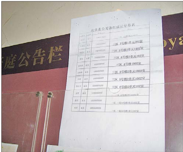
原先贴开会公告的地方被匿名者贴上了有业委会筹备组部分成员个人信息的告示。

据名士豪庭小区的几位业主代表说，因为牵扯到一些楼房顶漏水、车位锁维修不及时等问题，入住小区后业主们先是在网络论坛内讨论维权，后来感觉还是应该成立业主委员会，这样才能以组织的身份和物业方面平等沟通。于是，他们便从2011年11月正式开始商议小区业委会筹备事宜。