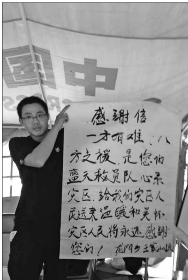
地震灾区居民给蓝天救援队的感谢信。

队员们说,他们最累的一次是卸了一辆25米长的货车物资,半车箱都是矿泉水,堆起来像座山。