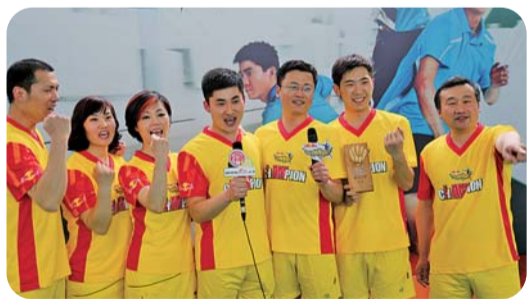
临沂站的冠军豪言“进军济南”。