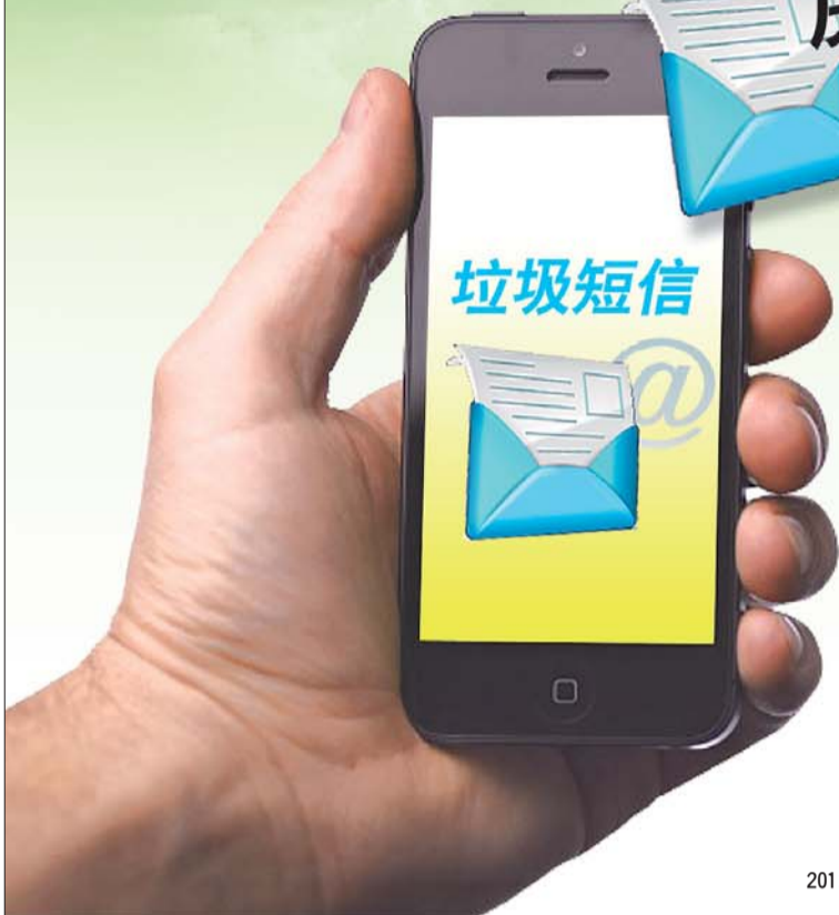
用户举报的垃圾短信内容分析