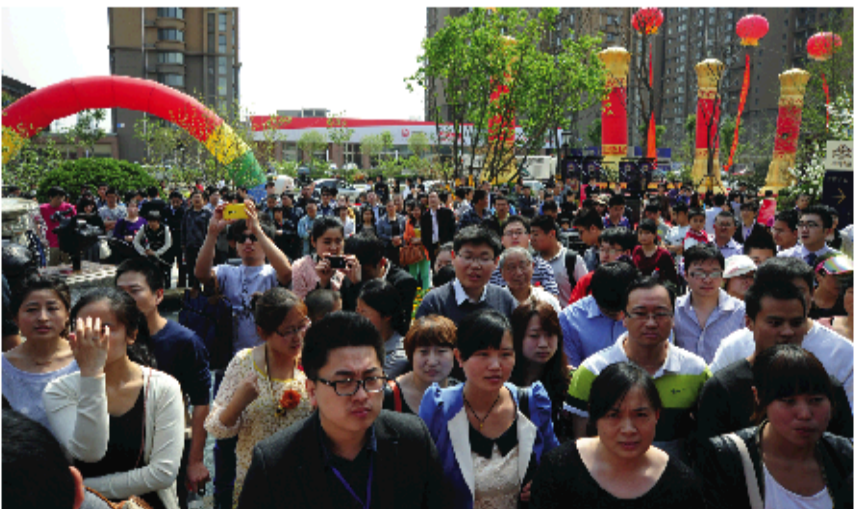
▲保利华庭营销中心盛大开放,现场人头攒动。

笔者了解到,园区金牌移植了多种名贵树种与花草,透露着济南保利置业打造品质升级社区的细致与用心。正如济南保利置业负责人所言,“这虽是一草一木,每一个环节布置,在将来,都是大家品质生活场景的一个缩影。今天的示范区只是我们营造