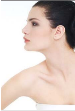
胶原蛋白和弹力纤维活性,瓦解深层色素,嫩肤美白,使皮肤光滑细腻,紧致有弹性! 咨询电话13954555093 咨询网站www.ytpay.com

飞顿冰点脱毛,除了拥有以上优势外,还拥有皮肤紧致模式,脱毛嫩肤一举两得!其独特激光紧致模式,在快速无痛脱毛的同时,极大促进真皮层