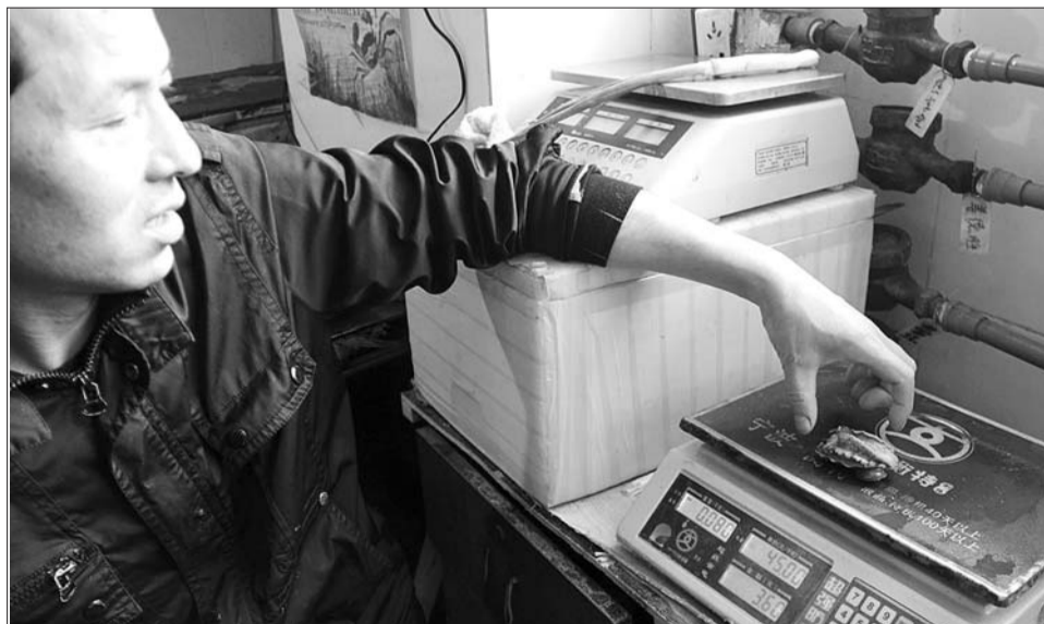
8日,威海一海产摊摊主称了一只鲍鱼,该品种售价每斤45元,秤上的这只仅售3.6元。