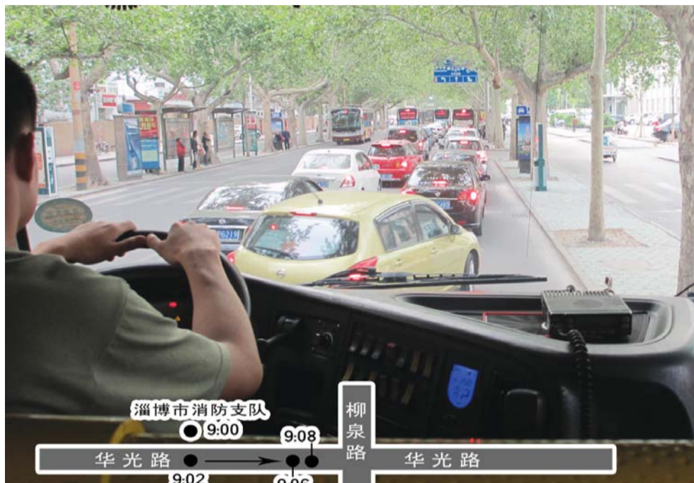
▲前边堵车,消防官兵干着急。

经过测试,上午9点出警到达兴学街张店宾馆附近耗时15分钟。下午5点左右正值下班高峰期,消防部门再次在同一线路进行测试,这次耗时25分钟。而在理想状态下,这一约5公里的路程只需7分钟。