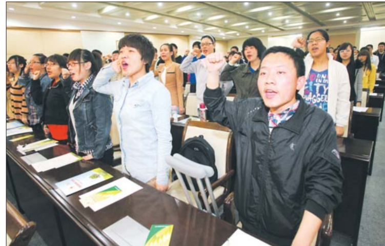
▲驻烟高校器官捐献志愿服务队成员宣誓。