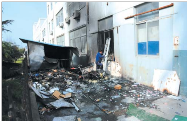
平板房里一片乌黑,地上到处是烧毁的物品。

“里面堆积着不少油漆桶,有40多桶左右。”附近工厂的马女士说,着火的板房只是用来堆积杂物的可能是有人丢掉了烟头,引燃了板房。