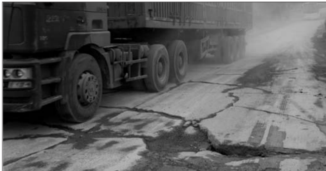
▲大货车从伤痕累累的淄中路上经过。

“目前,我们正在计划对部分路段进行整修,已委托相关单位完成了勘察设计工作。拟修路段自洪山镇车宋村至寨里镇孤山村,全长