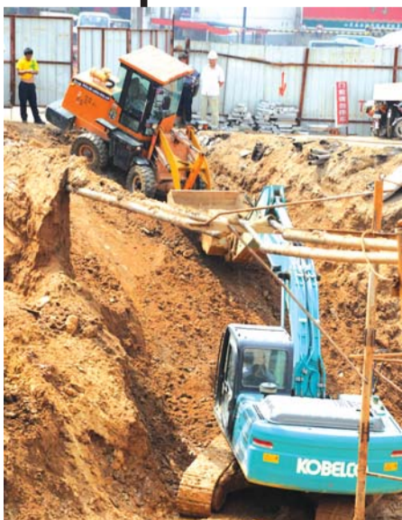
泰山火车站广场改造。(资料片)

中央商务区项目的实施,将从根本上改善财源大街西段落后现状,对于提升城市形象、优化区域交通、完善功能配套、增强竞争力、改善市民居住生活环境及增强城市集聚与辐射作用,均具有重要的现实意义。工程建成后,财源大街西段将成为环境优美、交通便利、居住舒适、商业发达的泰城“城市客厅”、市级商业商务中心、重要公共交通枢纽、有地方特色的24小时活力街区和标志性地段。