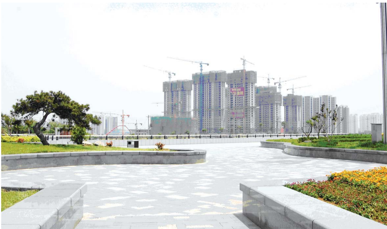
高铁新区逐渐变成卫星城。