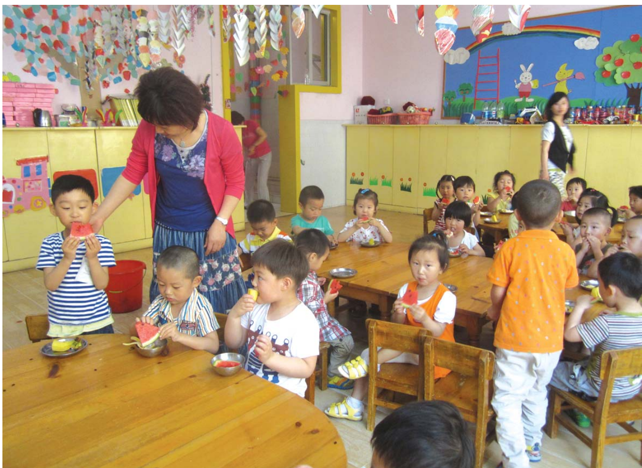
泰安市实验学校幼儿园小朋友课间在吃水果。

2011年全市新建和改扩建公办幼儿园154处,2012年新建和改扩建168处,2012年底公办及公办性质幼儿园占总数的80.47%,2013年计划再新建和改扩建162处。