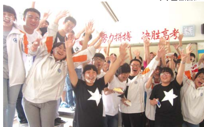
高三生即将参加高考。