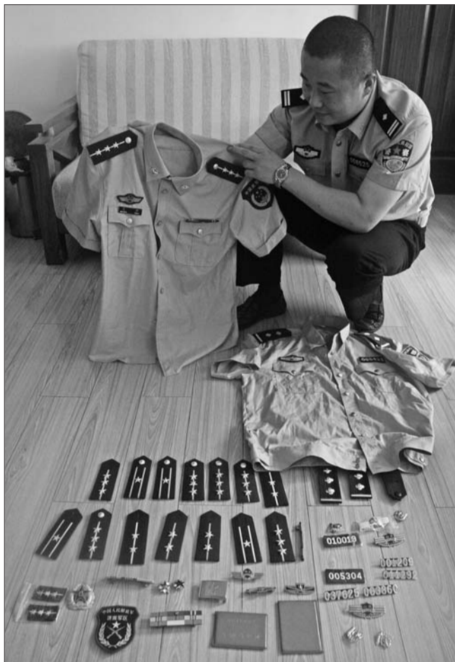
张某行骗时用的假警徽、肩章等物品。