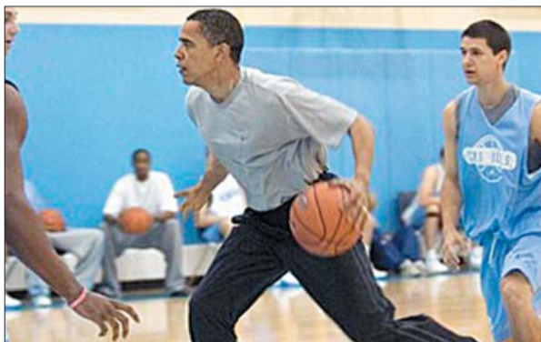
奥巴马经常在篮球场施展身手。(资料片)

习近平和奥巴马在青年时期都经历过艰苦的岁月。1969年1月,习近平到陕西延川县梁家河大队插队,在这里挑粪拉煤,拦河打坝,啃窝头睡土炕。而青年时期,奥巴马家境贫穷,肤色被人嘲笑,深感