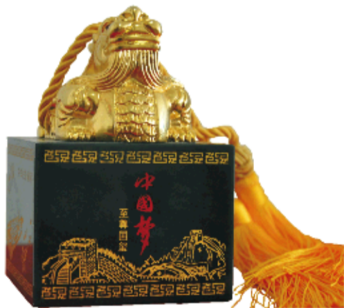
“中国梦·中华国玺”重2.3公斤,我国第一艘航空母舰、神舟飞船、天安门、56个民族大团结等中国元素精雕于和田玉之上,栩栩如生,犹如神来之笔。

和田玉在我国有七千多年的悠久历史,是中华民族文化宝库中的珍贵遗产和艺术瑰宝,具有极其深厚的文化底蕴。近年来更是价值飙升,以2.3公斤整块和田玉打造的超大规模国玺,充分体现了国人实现“中国梦”的高昂斗志!为见证每尊国玺都是珍品,国玺选用珍贵、稀缺的上等和田玉,只取玉胚,平均每8公斤和田玉,才能雕出一尊的玉印,成为珍品难得!