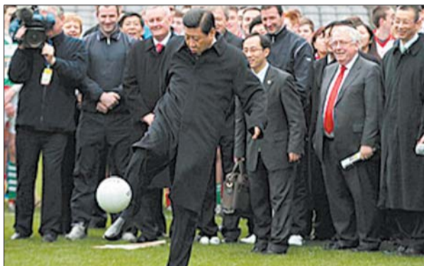
习近平在访问爱尔兰期间秀足球技。(资料片)