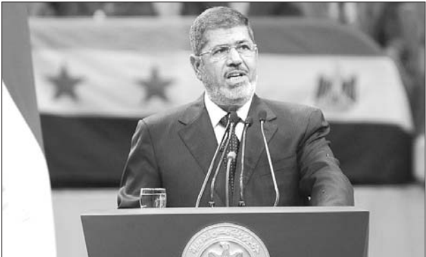
埃及总统穆尔西15日宣布埃叙断交。

本月13日,美国“认定”叙政府军对反对派武装动用化学武器,决定向叙反对派提供“军事支持”。埃及苏伊士大学政治学系主任萨拉马认为,美国在中东地区的盟国常常作出呼应美国中东政策的决定。埃及是这些盟国中的一员,穆尔西此举正是为了呼应美国对叙利亚反对派提供军事援助的决定。