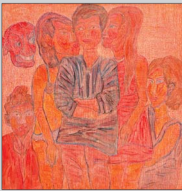
▲《白日梦》系列:欲望改变了所有