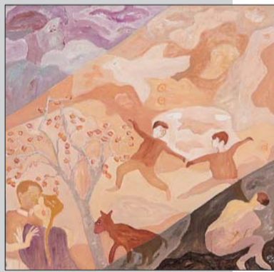
▲《白日梦》系列:当回忆成为一种习惯