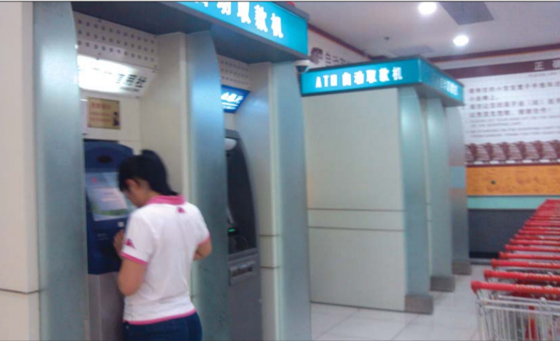
商场内ATM机缺少“隐私”空间。