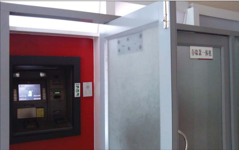
一家银行网点的ATM机安装了防护舱。

泰城室内外ATM自助设备越来越多,市民存取款越来越方便。但是商超内的ATM机大都没设防护区,有的一米线也没划。多家银行网点设置了ATM机器防护舱,但有市民进舱不锁门,仍然起不到防护的作用。