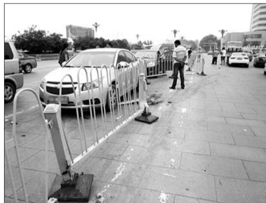
受损的护栏以及车辆。

本报济宁6月18日讯(记者 张林) 18日,济宁城区太白楼路中路(共青团路与太白楼路交叉路口附近)发生一起交通事故,一辆白色轿车上的司机不见了,“白色轿车撞上护栏,受损的护栏约有30多米,三辆正常行驶的车辆无辜受损,所幸没有造成人员伤亡。”