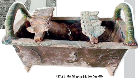
汉代釉陶烧烤炉清赏