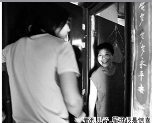
看到儿子,翟母很是惊喜。