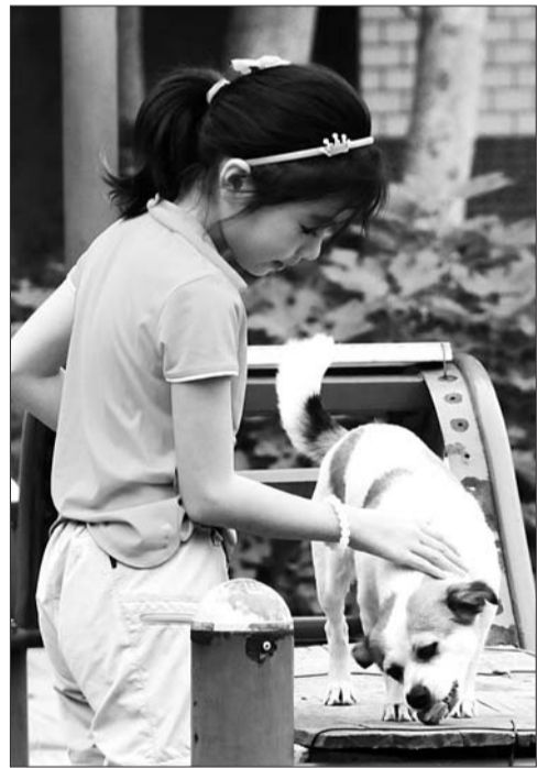
▶7个月过去了,彩虹对小主人已有些生疏。