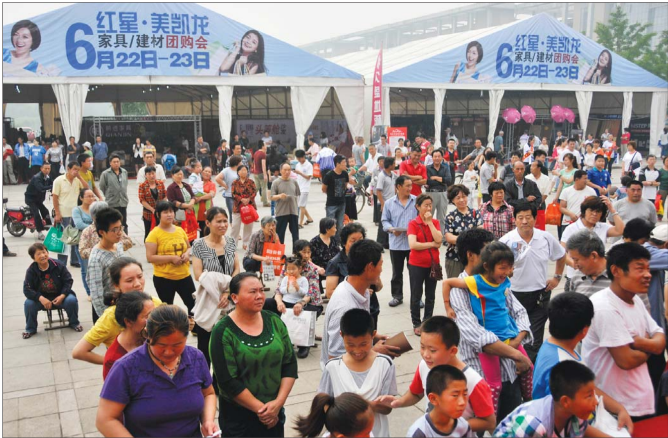
▲文化艺术节现场吸引了大量市民前来参观和购买。