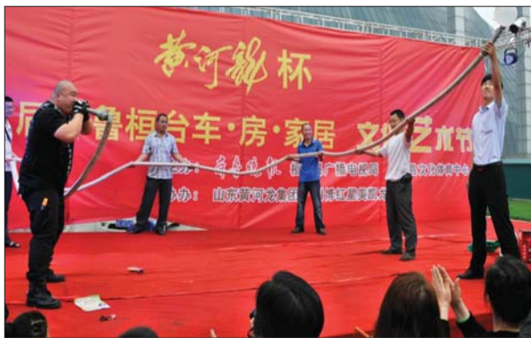
▲一名演员表演长管吹气球。

“这个模仿秀太有意思了,看了一遍还不过瘾,还想再看一遍。”特意从桓台城里赶到艺术节现场的刘女士告诉记者。