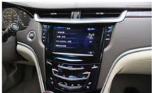
▲凯迪拉克CUE人机交互系统

凯迪拉克XTS装配了只在CTS-V、Corvette以及法拉利458等高性能跑车上才会运用的MRC主动电磁感应悬挂系统。MRC根据路况每秒对减震器调整可达1000次，堪称全球反应最快的悬挂系统。XTS同时采用独创的Hiper Struct前悬架，采用一体化的框架式结构，有效提升车辆的稳定性，并保持更好的贴地性，转向更为顺畅，结合先进的空气后悬挂，带来完美驾乘体验。