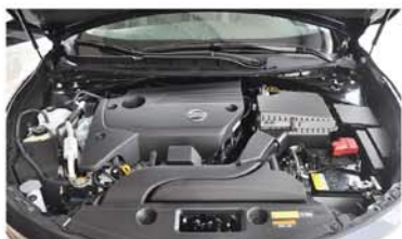
▲天籁发动机节油性能有口皆碑