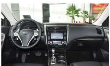
▲经过全新改版的天籁操控台更加人性化

新世代天籁凭借“低疲劳”、“轻松看”、“超静音”三大特点的有机结合，新世代天籁的劳损程度仅为同级其他车型的50%，为驾乘人员提供了健康舒适的用车享受。得益于由零重力的健康姿态座椅和双重减震系统两部分组成的，首创的零重力健康乘坐系统，新世代天籁为消费者提供最贴合人体腰背的支撑，强化整车稳定性，有效吸收过滤行驶中产生的震动，确保最舒适坐姿和最小震动。