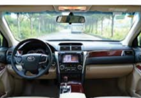
▲做工精致细腻的内饰

在5AR-FE双VVT-i高效能发动机与6速手自一体变速器的密切配合下，全新换代凯美瑞2.5L车型的最大输出功率提升10%，高达135kW，最大扭矩提升5%，高达235N·m，百公里加速时间为9.4秒，事实上在丰田内部实验，它的标准实验成绩为8.6秒，油耗却降低24%，综合工况百公里油耗仅为7.8L，在中高级车2.0L以上级别中更是首屈一指。