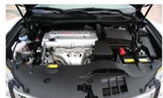
▲双VVT-i高效能发动机与6速手自一体变速器