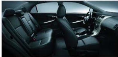
▲黑色内饰及真皮座椅。