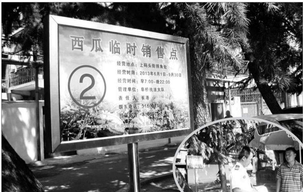
▲西瓜临时销售点指示牌。 ▶执法队员在西瓜临时销售点内向瓜农讲解相关政策。

上市的季节,河南等周边的瓜农就会驱车来到济宁城区内销售西瓜,由于没有固定的场所,经营比较随意,往年治理进城的瓜农依靠驱赶的方式,执法队员在治理时经常会遭到瓜农的抵制,从而产生一些争执。”济宁市城市管理综合执法局中