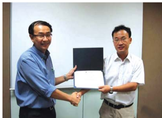
在新加坡中央医院学习期满,导师授予FELLOWSHIP证书。