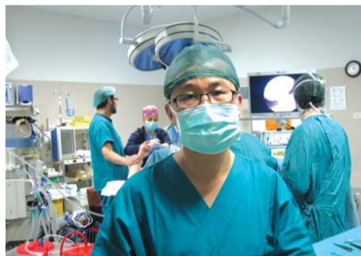
在意大利锡耶纳大学综合医院手术室。