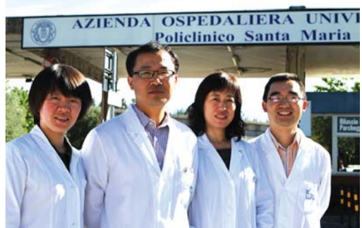
在意大利和同事在一起。