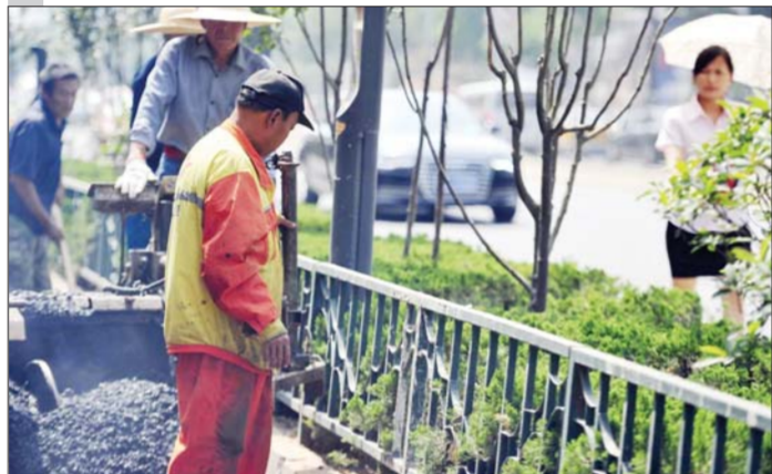
冒着高温忙碌的工人和旁边打着遮阳伞的路人形成鲜明对比。