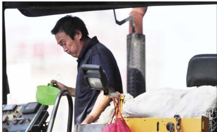
热得受不了了,拿起舀子“咕咚咕咚”喝上几口凉水。

的劳动强度。同时6月、7月、8月三月份,在12时至下午2时时段增加一遍洒水降温、降尘作业。 各区城管局应及时发放防暑降温物资,各单位应创造条件为一线保洁员提供良好的生活、工作环境,购置必要的防暑降温物品,包括配备必要的防暑药物、毛巾、降温饮料等物品。 同时,城管局还要求完善作业路段上的避暑设施,在沿街公厕、转运站等设施内设置保洁员休息间,在道路两侧设置保洁员歇脚点,还应积极发动沿街单位提供保洁员休息区域等,防止因高温天气出现的中暑现象发生。