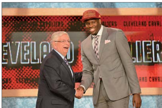
NBA联盟总裁斯特恩与状元秀本内特握手。

NBA总裁大卫·斯特恩最后一次主持选秀,明年斯特恩将会退休。据统计,30年来从斯特恩口中念出的首轮新秀