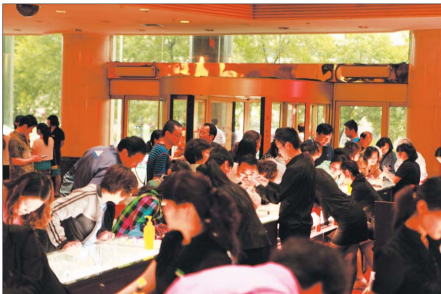
济南直销惠现场火爆

4、联系电话:本次直销惠购买翡翠,如出现质量问题等相关事宜可直接拨打缘与翠13953295966电话咨询。